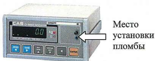
Рисунок 2 - Схема пломбировки СИ-6000А

Схема пломбировки представлена на рисунке 2.