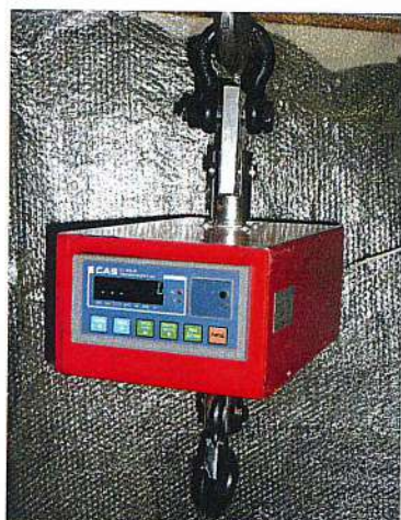
в комплектации с СИ-6000А

Общий вид весов крановых электронных КВ представлен на рисунке 1.