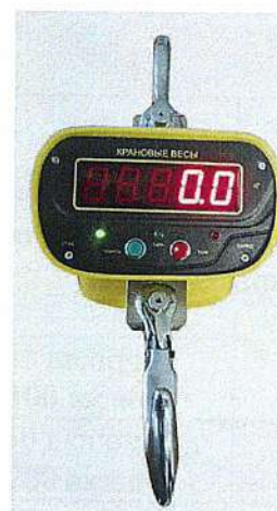
в комплектации с КСК22